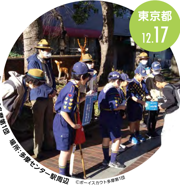
団体名:BS多摩第1団 場所:多摩センター駅周辺