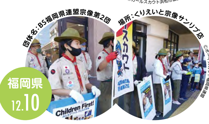
団体名:BS福岡県連盟宗像第2団 場所:くりえいと宗像サンリブ店