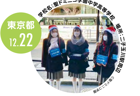
学校名:聖ドミニコ学園中学高等学校 場所:二子玉川駅周辺