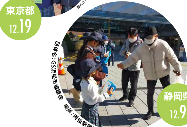
団体名:GS浜松市協議会 場所:浜松駅周辺