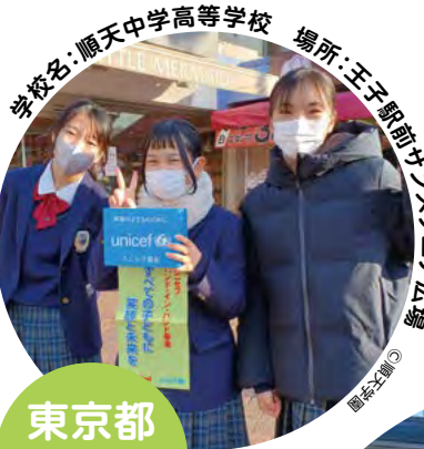
学校名:順天中学高等学校 場所:王子駅前サンエシア広場