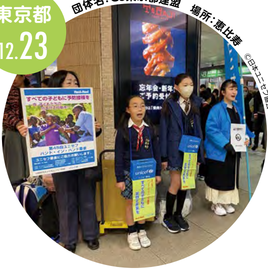
団体名:GS東京都連盟 場所:恵比寿