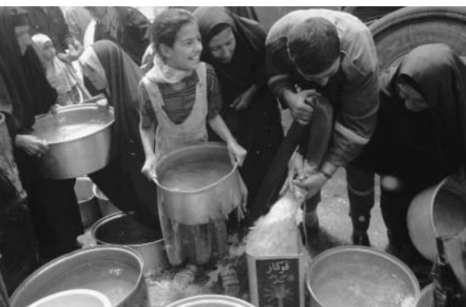
給水車で飲料水を供給する様子

イラクでのユニセフの支援活動は 1952年に開始されました。イラクは石 油資源の豊富な国で、民主的で安定し た政権があれば子どもの状況は現在の ようになるはずはないのです。ところが、 長期化したイラン・イラク戦争(1980～ 1988年)に巨大な戦費を注ぎ込み、経済 が疲弊し、保健や教育などの予算を削 らざるを得なくなりました。