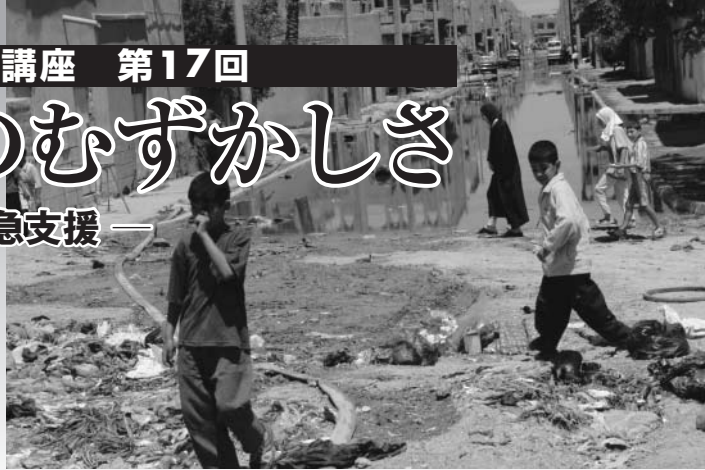
ごみが散らかった街の中

治安の回復していない国での人道支援事業のむずかしさを思い知ら されると同時に、命がけの仕事であることを改めて認識させられます。