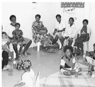
カウンセリング室

ジョン君（仮名）も孤独でとてもきびしい生活をしていますが、明るさと思いやりを忘れず、強く生きていこうとしています。