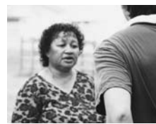
ユニセフの支援を受けて活動するカウンセラー