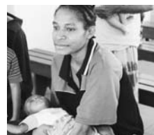
病院にきている母子

A：問題は同じです。だからこそ、手を打てば、アフリカでの教訓を生かすことができ、感染の拡大を防ぐことができるのです。「早期」に対策を打つことが大切です。