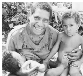
感染予防は重要な取り組み