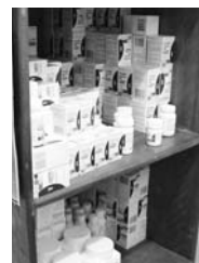
提供するための薬

A：国際社会からの支援により、エイズ発症を遅らせる薬は2012年まで確保されています。でも、薬は、ずっと飲み続けられる人でないともらえません。中止すると薬が効かなくなるからです。地理が複雑で、交通網も発達しておらず、病院が少ないこの国では治療は困難を極めます。だからこそ「予防」が大切なのです。