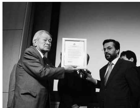
澄田会長への贈呈のようす