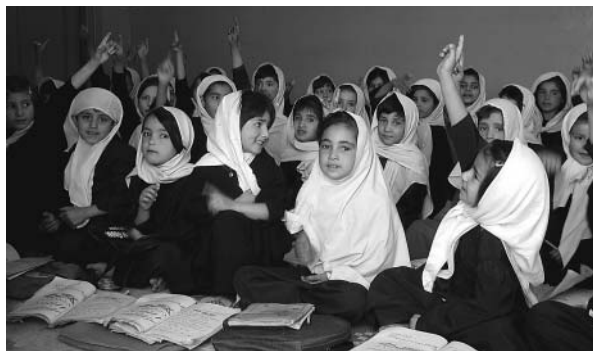
元気に学ぶ女の子たち