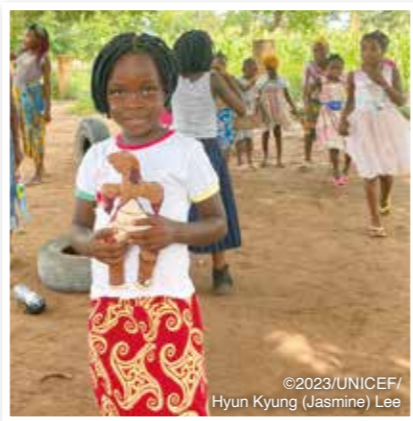
「遊び」も、大切な授業の一環です。

短期集中就学準備プログラムの実施には、就学前教育の重要性を理解する保護者と、適切な授業スキルを持った教員の存在が欠かせません。プログラムに参加した 子どもたち8,020人の保護者 は、4週間・全13回の講習会に参加。就学前の準備の重要性や乳幼児期の脳の発達について学び、好奇心を満たす刺激の必要性に加え、子どもへの愛情の示し方や注意の仕方、子どもの自信や自尊心を育む方法、基本的な算数や言葉の教え方などへの理解を深めました。また、 小学1年生の担当教員115人 は、就学前の子どもたちがスムーズに学校生活に適應できるように、遊びを取り入れた指導方法や小学校低学年向けの学習アプローチ、地域で手に入る材料を使った教材の製作方法などについて研修を受けました。