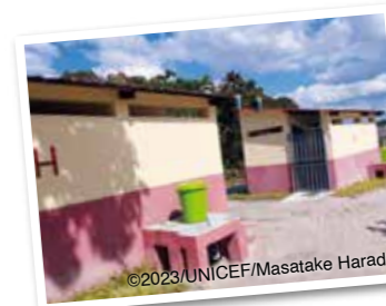
手洗い場を備えた児童用のトイレ