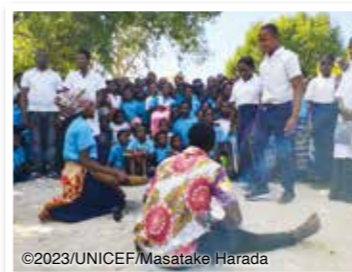
学校クラブに参加する子どもたち