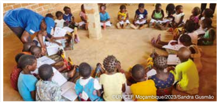
短期集中就学準備プログラムに参加する子どもたち

ユニセフはモザンビーク教育省と協力し、小学校入学前の子どもたちが基礎的な学習スキルを身につけるための短期集中就学準備プログラムを展開しています。この1年間で、5～6歳の 子どもたち8,020人 が、120時間(1日3時間、週5日を8週間)のプログラムに参加しました。プログラムの目的は、効果的な学習を促進するとともに、現地語しか話せない子どもたちが公用語のポルトガル語を理解できるようになること