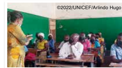
学校運営における役割と責任を学ぶ学校運営委員会のメンバー