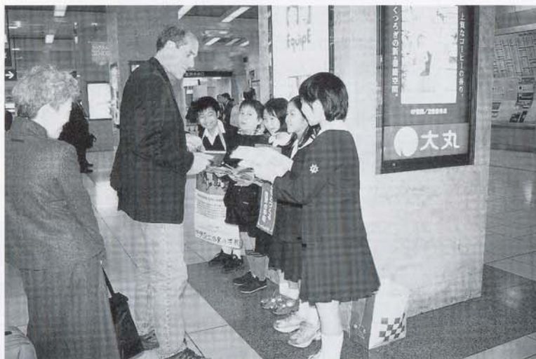
△「がんばってくださいね」と励まされ心が熱くなりました。(東京駅にて)

城東小学校では、毎年ユニセフ募金活動に取り組んでいます。事前学習では、5・6年の実行委員会が主催してユニセフ集会を開き、ユニセフの活動の大切さを学びました。日本ユニセフ協会からお招きした職員の方から、私たちと同じぐらいの年齢の子どもたちが大変な苦勞をして生活していることを伺って、自分たちはなんと幸せなんだろうと実感しました。そして、そうした子どもたちのために少しでも支援をしたいと思い、校内と東京駅で募金活動へのご協力を呼びかけました。