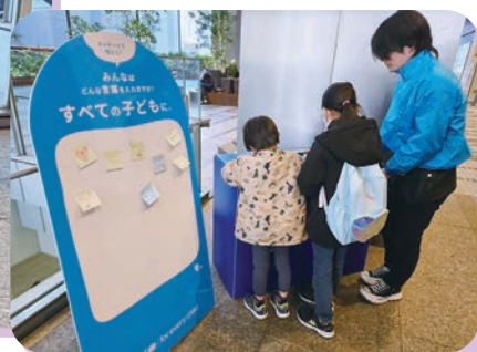
ユニセフの活動を紹介