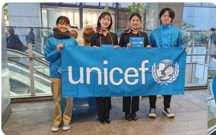
日本航空のCA、大学生ボランティア「ユニセフキャンパス」の皆さま