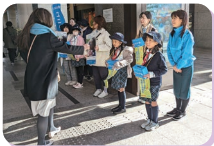
ガールスカウトの皆さま：新宿高島屋前