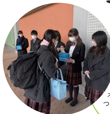
◎八王子学園 八王子中学校 ・高等学校