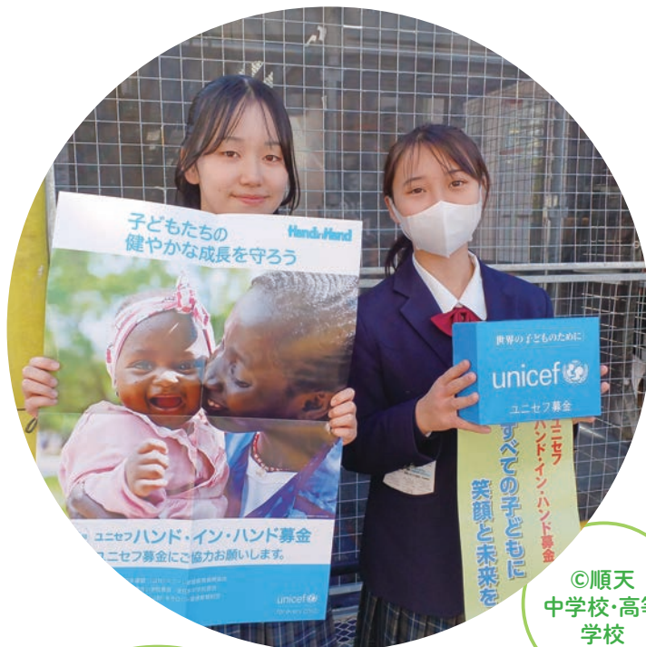
◎順天 中学校・高等 学校