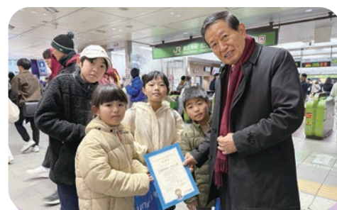
ボランティアのコープみらいの皆さまに 日本ユニセフ協会会長 高須より感謝状をお渡し