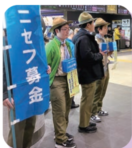
ボーイスカウトの皆さま： 東武北千住駅