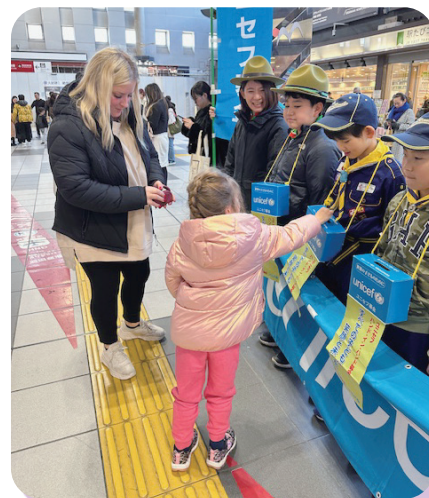
ボーイスカウトの皆さま：JR品川駅