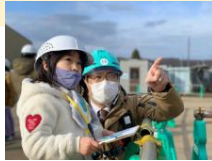
義務教育学校建設現場を見学する小学生

もともと総合計画における優先政策として、「子育て・教育分野」を掲げていましたが、CFCIに取り組むことで新しい視点を入れています。特に、以前はほとんど意識がなかった「子どもの意見を聴く」という点において、職員研修会の実施や具体の事業実施の中で、職員間で、共通言語化されつつあります。