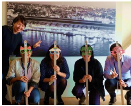
手作りの小道具を使って、子どもの視点でまちを考える試み

子どもにやさしいまちをつくることは、おとな中心の発想や基準で進められてきたまちづくりに、子どもの視点を加えること。「まち」をいろいろな人の立場から発想する意識の醸成や施策、しくみづくりによって、「子どもにやさしいまち」は誰にでもやさしいまちになるのです。