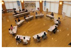
「とみやわくわく子どもミーティング」

「富谷市総合計画・後期基本計画」に、「子どもにやさしいまちづくり」の視点を加え、全庁的な取り組みとして推進しております。「子どもにやさしいまち」は、「だれにでもやさしいまち」の考えのもと、子どもの意見を市政に反映するなど、子どもの視点が意識されつつあります。