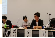
高校生が参加する町田市市民参加型事業評価

CFCIを実行することで、国際基準により新たな視点を取り入れて市内のあらゆる施策をブラッシュアップすることができると思います。また、ユニセフの理念に沿った施策を展開し、国際的な評価を得ることができるため、「このまちに住み続けたい」という子どもを含めた市民の誇りや愛着、定住意欲の醸成に繋がるものと考えています。