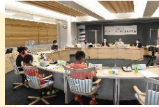
「ニセコ町まちづくり基本条例」に基づく「子ども議会」

これまで町が進めてきた事業や考え方を、CFCIが後押し、裏打ちしてくれると考え、取り組みをスタートしました。ニセコ町はSDGs未来都市に指定されています。CFCIはSDGsにつながっています。子どもの育つ環境が良くなっていけば、人口の問題にも有効だと思います。子どもの力を借りて、社会を元気にしていきたいと思っています。