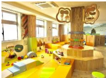
「地域子育て支援センターにじいろ」

子どもという切り口で全庁横断的に中長期に仕組みをつくっていくというのは簡単ではありません。しかし、CFCIを推進することで、女性や高齢者、性的マイノリティの方等にも優しいまちになると考えます。少子化の問題も危惧的な状態ですし、長期的に見た時に、社会全体にとって必要な取り組みだと思っています。