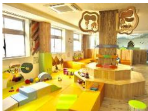
「地域子育て支援センターにじいろ」

子どもという切り口で全庁横断的に中長期に仕組みをつくっていくというのは簡単ではありません。しかし、CFCIを推進することで、女性や高齢者、性的マイノリティの方等にも優しいまちになると考えます。少子化の問題も危機的な状態ですし、長期的に見た時に、社会全体にとって必要な取り組みだと思います。