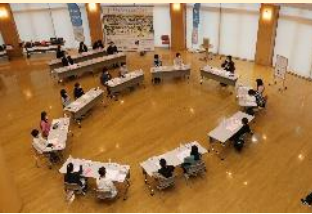
「とみやわくわく子どもミーティング」

「富谷市総合計画・後期基本計画」に、「子どもにやさしいまちづくり」の視点を加え、全庁的な取り組みとして推進しております。「子どもにやさしいまち」は、「だれにでもやさしいまち」の考えのもと、子どもの意見を市政に反映するなど、子どもの視点が意識されつつあります。