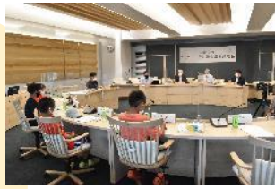
「ニセコ町まちづくり基本条例」に基づく「子ども議会」

これまで町が進めてきた事業や考え方を、CFCIが後押し、裏打ちしてくれると考え、取り組みをスタートしました。ニセコ町はSDGs未来都市に指定されています。CFCIはSDGsにつながっています。子どもの育つ環境が良くなっていけば、人口の問題にも有効だと思います。子どもの力を借りて、社会を元気にしていきたいと思っています。