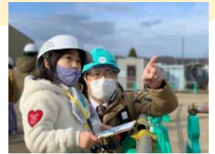
義務教育学校建設現場を見学する小学生

もともと総合計画における優先政策として、「子育て・教育分野」を掲げていましたが、CFCIに取り組むことで新しい視点を入れています。特に、以前はほとんど意識がなかった「子どもの意見を聴く」という点において、職員研修会の実施や具体の事業実施の中で、職員間で、共通言語化されつつあります。