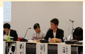
高校生が参加する町田市市民参加型事業評価

CFCIを実行することで、国際基準により新たな視点を取り入れて庁内のあらゆる施策をブラッシュアップすることができると考えます。また、ユニセフの理念に沿った施策を展開し、国際的な評価を得ることができるため、「このまちに住み続けたい」という子どもを含めた市民の誇りや愛着、定住意欲の醸成に繋がるものと考えています。