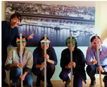
手作りの小道具を使って、子どもの視点でまちを考える試み