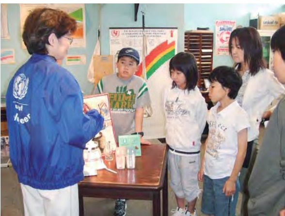
ユニセフハウスをおとずれた豊原小の子どもたち