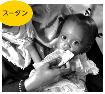
重度の栄養不良になり治療を受ける1歳の女の子。多くの国で栄養不良の子どもたちが増えている。

いま、これまでになかったような食料・栄養危機が世界でおきている。もともとひどい影響を受けている4540万人の子どもたちが、食事が極端に不足し、ひどい栄養不足(消耗症)で、命を失う危険に直面している。また、いつも栄養が足りず、からだや脳が十分に発達できない子どもの数は、世界で1億5000万人にもなっている。