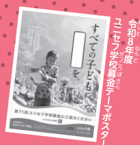
令和7年度 ユニセフ日本国代表部 「すべての子どもを」テーマポスター

地震や洪水などの自然災害によって子どもが受ける影響の大きさは、国によって差があります。教育が再開するまでに、紛争や貧困に苦しむ国ほど長い時間が必要で、時には数年かかることもあります。