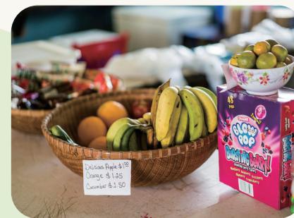
© UNICEF/UNI521878/San Diego - Highway Child

バザーの収益をユニセフ募金にさせていただくことで、多くの方に世界の子どもたちに想いを馳せ、協力していただく機会となります。