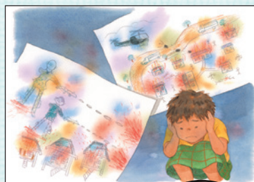
紛争のために ミャンマーから バングラデシュ に逃れたモン ズールくん