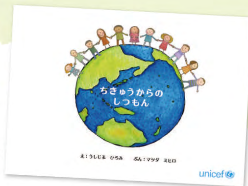
(絵本型資料 A4 横開き 22 ページ)

海洋、森林、気候、人権、社会…。さまざまにつながっていく問いに対して、園児の皆さんからはどんな答えが返ってくるでしょう?ぜひ、すてきな世界を想像してほしいと思います。