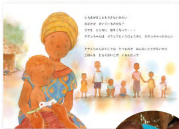
アデュちゃん 南スーダンで栄養不良に苦しんだ女の子

さまざまな環境下で暮らすおともだちのようすに、園児の皆さんはどのような気持ちを抱くでしょう。