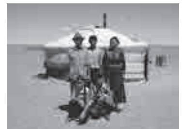
遊牧民の家族