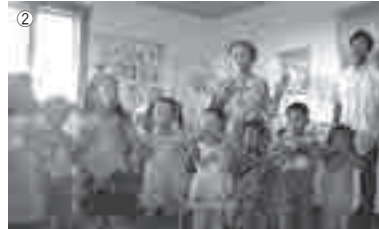
①身元確認センター ©諸遊正彦 ②幼稚園 ©日本ユニセフ協会 ③バヤンゴル地区の衛生的なトイレ ©日本ユニセフ協会