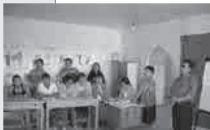
パネルを使いながら、ボランティア育成の学習会

私たち参加者は、隣人への理解と協力こそが大切であることを改めて学ぶ夏となりました。そして学ぶことにより、考え・行動する日本の若者が多く現れるよう学習を展開していきたいと感じています。