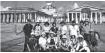
スタディーツアー参加者 ©諸遊正彦 (スタディーツアー参加者)

日本ユニセフ協会はモンゴルとカンボジアで事業を指定した募金を行い、支援をしています。毎年、子どもたちの状況や事業の取り組みを先生たちに実際に視察していただき、それを学校や地域で学習や広報活動に役立てていただいています。2004年度のモンゴルスタディーツアーに参加された小学校、中学校、高校の先生の感想や意欲的な取り組みをご紹介します。