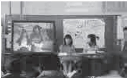
ニュースショーで伝える子どもたち

市のふれあい教育の公開授業の日を伝える活動の日と決めました。「世界と手をつなごう」をテーマとして、「ストリートチルドレン」「5歳の誕生日を迎えられない子どもたち」「戦争や災害で被害を受ける子どもたち」「教育を受けられない子どもたち」の4グループに分かれ、各自調べたことを教えあい、伝える方法として、劇・紙しばい・ニュースショー・パソコンを使ったポスターセッション・体験ツアーなど様々な方法で取り組みました。ユニセフライブラリーから借りたビデオやパネルを使って実に多様な生き生きとした活動が行われました。伝える対象は先生や保護者、他学年の児童へと広がっていきました。6年生は自分たちの活動に満足し、自信を持ちました。「6年生になったらああいう活動がしたい」と期待させる学習として大谷小学校に定着させていきたいと思います。