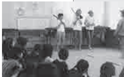
劇で伝える子どもたち ©朝井美智