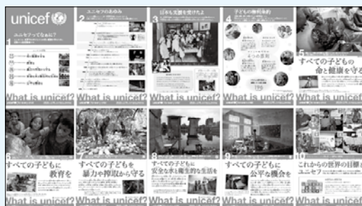
(「ユニセフってなあに」)