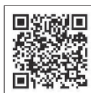
ユニセフ緊急募金

災害や紛争などの非常事態下の子どもたちへの緊急・復興支援のための募金です。2020年3月現在、受け付けている緊急募金は「ロヒンギャ難民緊急募金」、「シリア緊急募金」「自然災害緊急募金」「アフリカ栄養危機緊急募金」「人道危機緊急募金」の5つですが、募金の性質上、終了することがございますので、活動前に、必ず最新の情報をホームページでご確認ください。