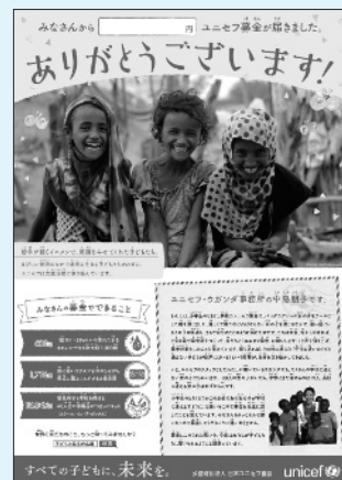
※ポスターは昨年のもので、(今年のポスターはデザインが異なります。)