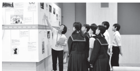
ボランティアによるガイドツアー（無料・要予約）

新型コロナウイルスの感染状況がおさまるまで、ボランティアによる対面でのツアーは休止とさせていただきます。展示物の説明は、ご自身のスマートフォン等にて映像でご覧いただけるようになっています。タブレット端末の貸し出しも行っておりますので、ご予約時にお申し付けください。