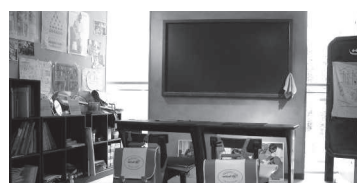
開発途上国の学校（再現）の展示