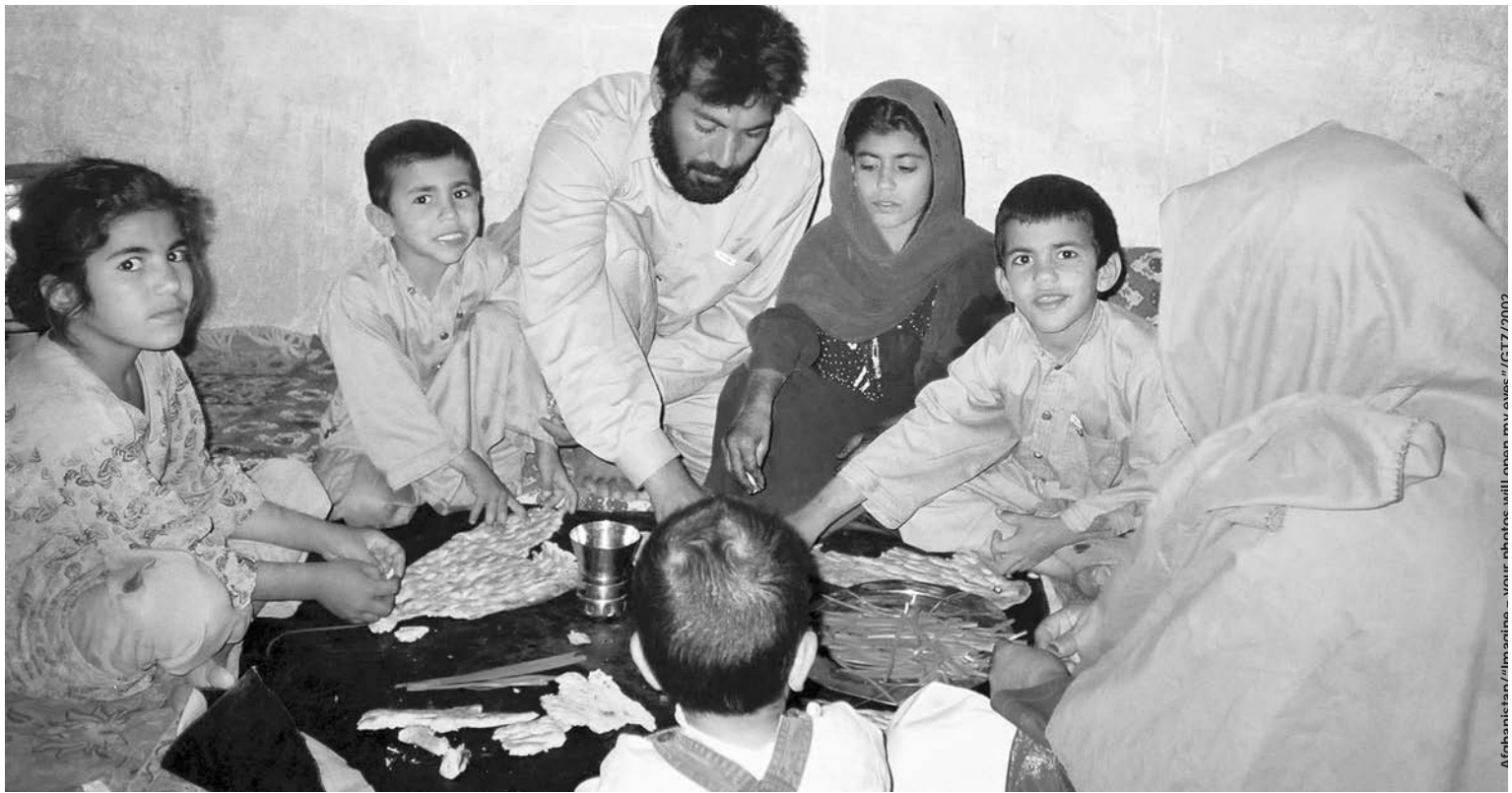
© Fabianista/Alamy.com - your photos will mean my voice / ICT/2002

学生議会は、セルジオ・ヴィエイラ・デメロ国連暫定行政機構代表の諮問機関である憲法制定議会が最高機関だった東ティモールで、初めて開かれた議会である。国民によって選ばれたシャナナ・グスマン大統領は、閣僚評議会とともに、学生議会の9日後にデメロ氏から統治権限を引き継いだ。学生議会の報告書は、正式な議会に対し、2002年の会期中に提出される予定である。ユニセフは教育省と調整を図りながら、2002年度中にいくつかの高校に学生議会を設置する予定にしている。