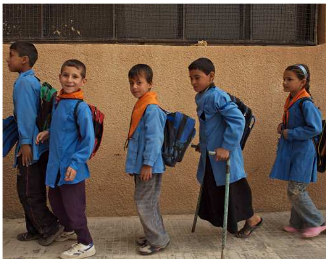
整列して教室に入る生徒たち (2007年シリア)