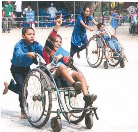
バングラデシュにて、学園祭に参加する障がいのある子どもたちと障がいのない子どもたち

能力の向上は、障がいのある子どもたちを受け入れ、その教育的ニーズを満たす意志と能力が学校制度に備わっていると、より大きな効果をもたらすことになる。さらに、障がいのある人々の雇用を促進するための、学校から仕事へのインクルーシブな移行プログラムと経済全体の取り組みもあると、学校教育を受けることがさらに有意義なものになるであろう。