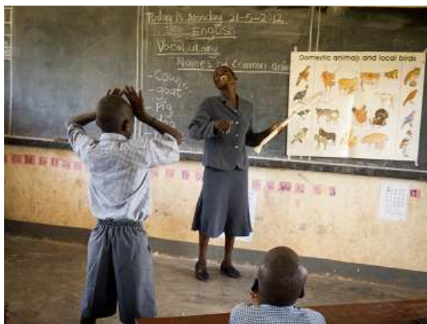
聴覚障がい児クラスを教える聴覚障がいのある教師（ウガンダ）