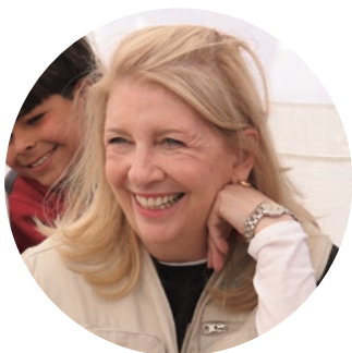
キャサリン・ラッセル ユニセフ事務局長

しかし、世界には今も何億人もの子どもが毎日同ような脅威に直面しています。子どもの貧困と闘うこの機運を、決して失わせてはなりません。