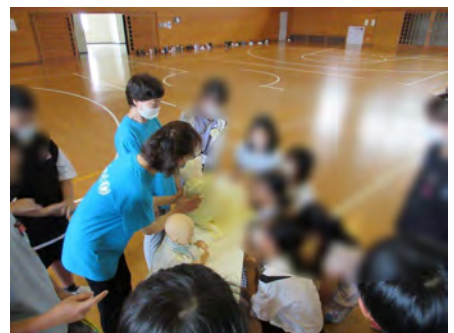
「何か月の赤ちゃん？」とみんなで想像していました。