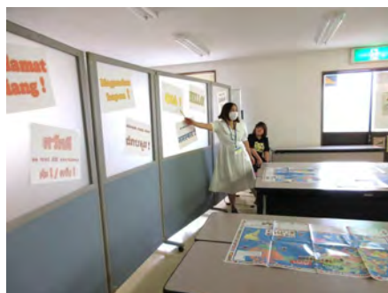
世界のあいさつを紹介しています。