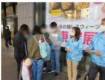
声が届き募金につながりました