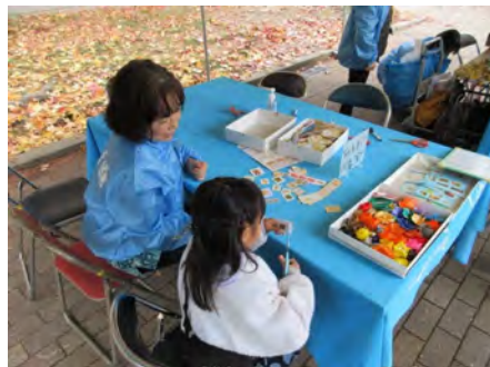
幼いお子さまでも参加できる切手整理ボランティアです。