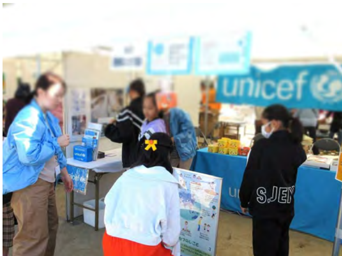
普段から少し水の量を変えて、水がめの重さあてクイズを行いました