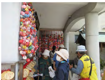
フォトスポットにもなっている 円満寺