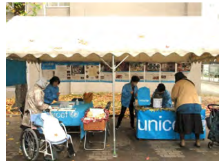
幅広い世代の方とお話できました。