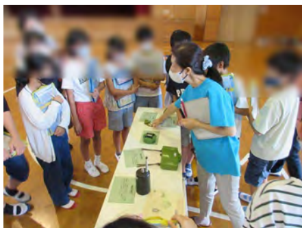
地雷のレプリカの展示