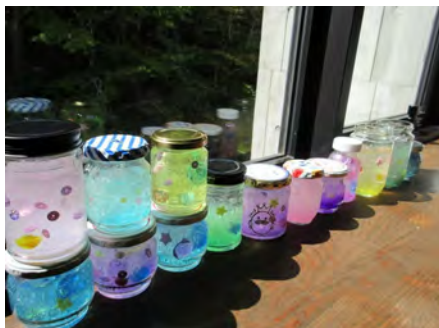
保冷剤を使用した消臭剤づくり。カラフルな仕上がりに