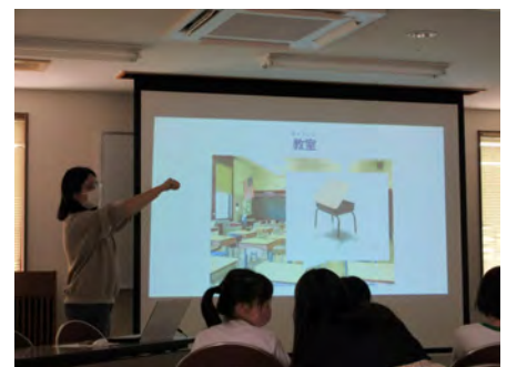
アメリカの小学校で使われている机を紹介。異文化に興味を持つきっかけになると嬉しいです。