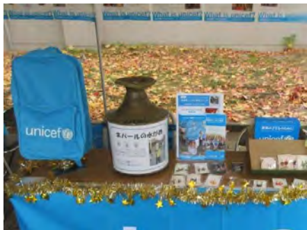
ユニセフバッグなど足をとめてみてくれました。