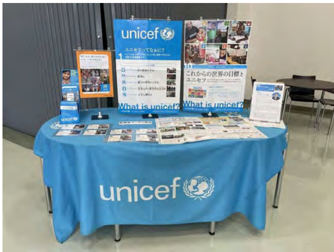
8月17日 新体操会場にて