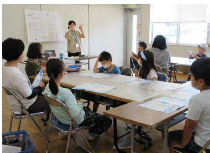
みなさんからのご寄付により集まった外国コインです。