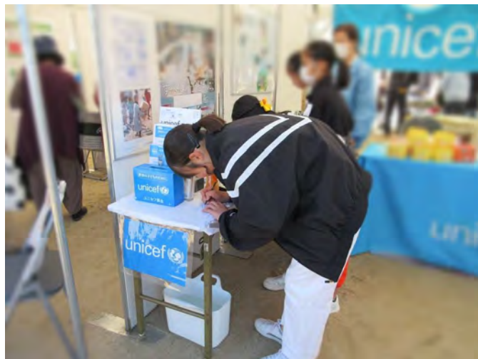
「すべてのこどもに〇〇を」のメッセージも書いてくれました。