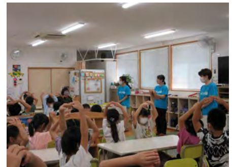
元気よく〇×クイズに参加してくれました。