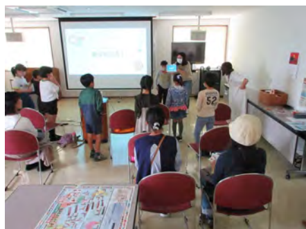
こどもの発表や質問が活発で、英語ゲームも盛り上がりました。