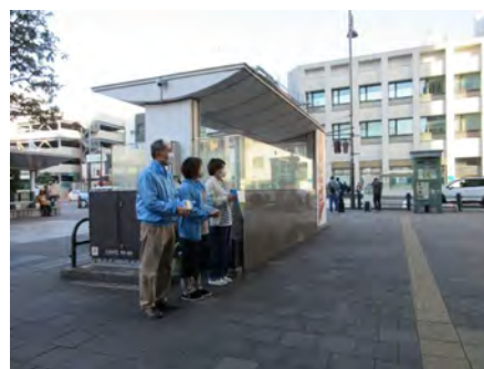
高島屋前3カ所にて活動しました