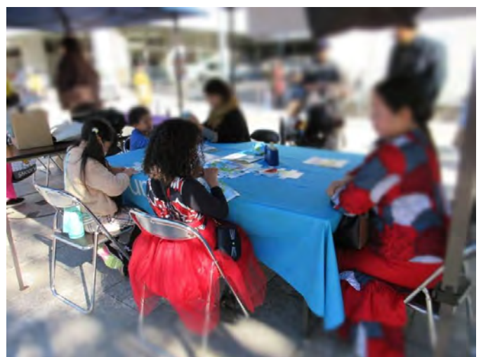
地球儀を立体的に組むのは少し難しそうでした