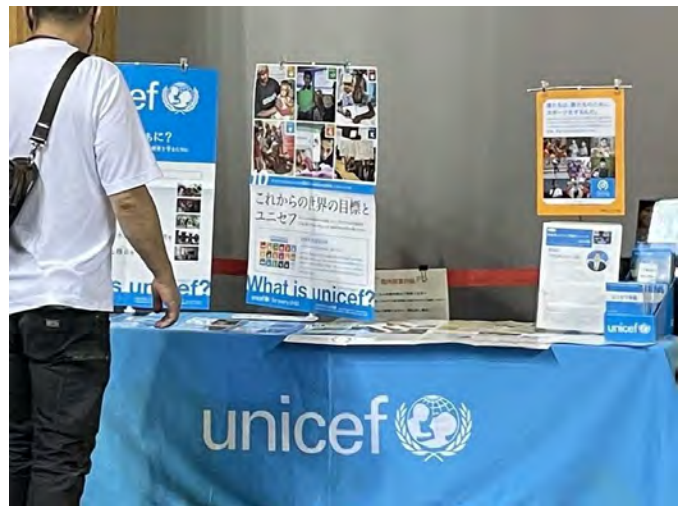
8月18日 剣道会場にて