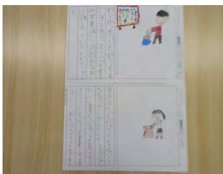
この水がめをおうちまで運べるか想像してくれました