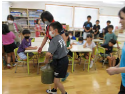
水がめ運び体験。頑張る子どもたち