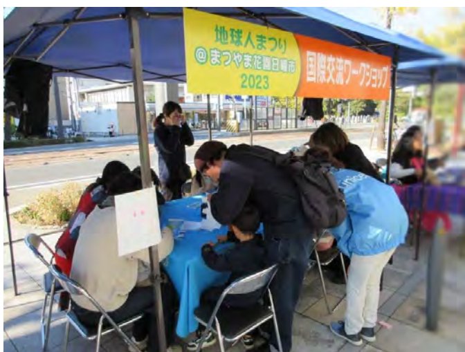
短時間でしたが多くの親子にご参加いただきました