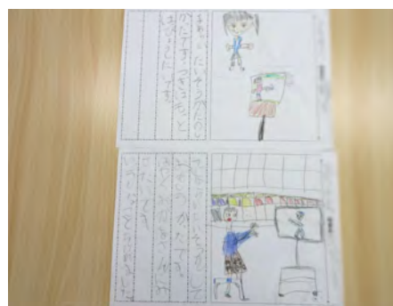
ユニセフの「世界手洗いダンス」気に入ってくれたようです