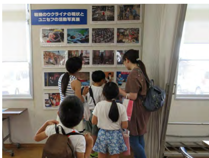
会場ではユニセフの展示を行い、小さなお子様も関心を持ってくださいました。展示は8月末ごろまで行っています。