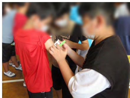
上腕スケールを体験