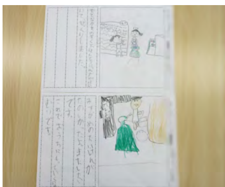
ネパールの女の子の気持ちになって 水がめをもってくれました