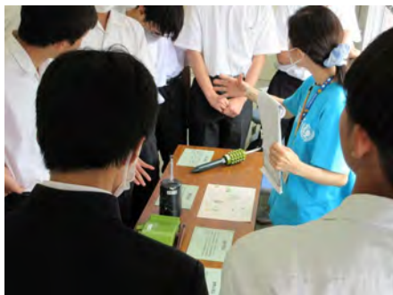
地雷のレプリカを見てもらいました。