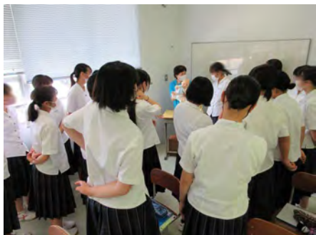
赤ちゃん人形を抱っこしてもらいます。