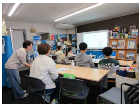
募金活動のミニ講習も真剣に聞いてくれました