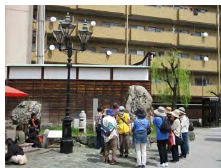
みなさん無事にゴールできました。