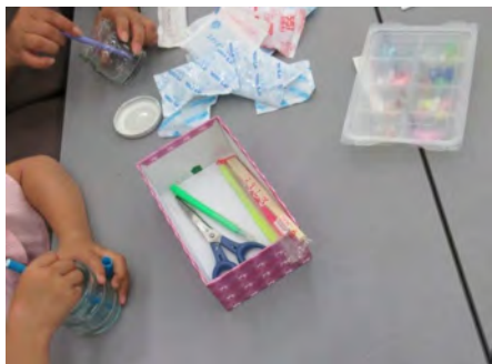
コープによる保冷剤を使ったアップサイクル活動。