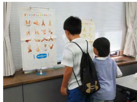
手の洗い方のポスター、しっかり読んでくれています。