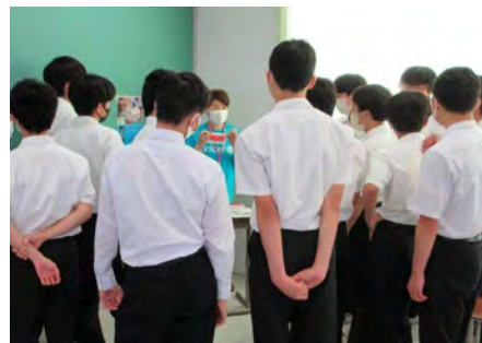
プランピーナッツの説明をしています。